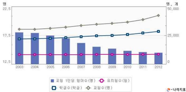
[그림 4] 우리나라 유아교육 규모

○ 대한민국정부 수립 후 교육계는 식민지 후유증, 해방 후 혼란, 전쟁, 정부의 무관심 등으로 발전의 기틀을 다지지 못하였다. 특히, 유아교육은 정부와 사회의 무관심으로 1970년대까지 유치원 취원율이 2% 내외였다. 그러나 1980년대 유아교육의 중요성이 국가적인 차원에서 인식되면서 현재 한국의 유아교육은 양적 및 질적 성장과 함께 교육의 접근성 및 평등성을 이루었다. 따라서 한국의 유아교육의 발전 모델은 전쟁 및 식민지를 경험한 수원국에게 가장 적합한 모델로 제시될 수 있다.