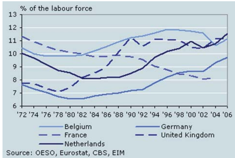
〈도표 2〉 유럽 주요국의 기업가 정신 통계 (가로축은 연도, 세로축은 노동력 중의 기업가 비율)

이렇게 네덜란드의 기업가 정신이 높은 이유는 네덜란드인들이 비교적 주변의 다른 나라 사람들보다 위험 부담을 그리 두려워하지 않고 새로운 도전들을 오히려 잘 받아들이는 편이기 때문이다. 이것은 지난 황금시대부터 국제 무역을 통해 체질화된 하나의 국민성이라고 말할 수 있다. 하지만 다른 유럽의 국가들은 새로운 아이디어가 떠올라도 바로 거기에 뛰어드는 데에는 시간이 조금 걸린다고 슈링스(Ute Schurings)는 지적한다(Schurings, 2003). 이러한 점이 네덜란드가 다른 유럽 국가들과 차별되는 한 부분이라고 말할 수 있다.