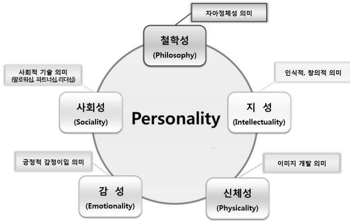
PIPES 인성교육 모델