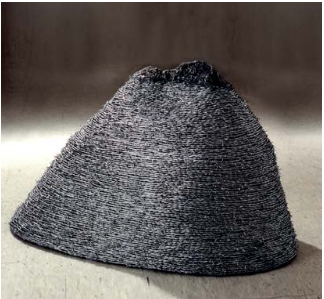
고난의 산 I, 105 x 115 x 60cm, 철근과 철조망, 1995년