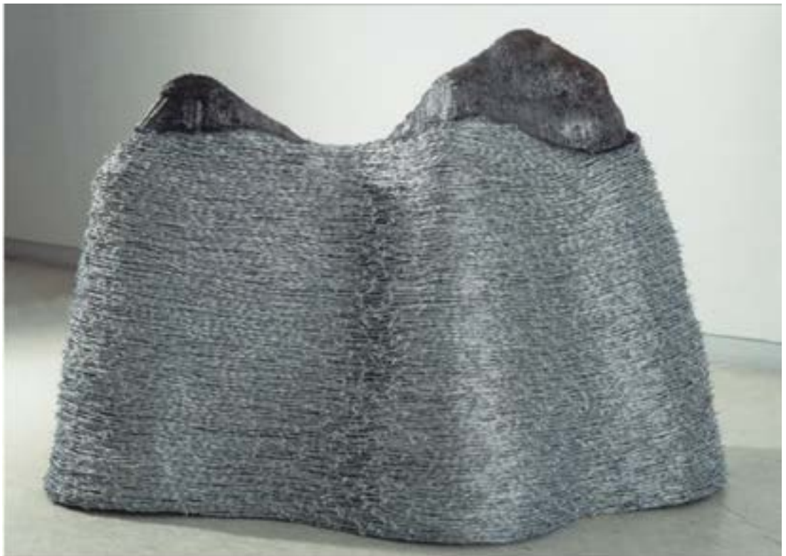
고난의 산 II, 165 x 70 x 130cm, 철근과 철조망, 1995년

나의 작품을 스스로 구분 지어보면 크게 세 가지 정도이다. 첫 번째로 1996년 첫 번째 개인전 전후의 경향을 들 수 있다. 이런 구분의 근간에는 우리나라의 분단의 역사와 관계가 있다. 나의 결연 분단 때문에 빨리 보이는 고향을 눈앞에 두고 가지 못하는 팔십 대 중반의 실향민, 고통과 슬픔을 지